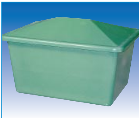
Dimensions du local technique : L x l x H = 1630 x 1210 x 1004 mm

Local technique enterré ou hors-sol : gain de temps - idéal pour piscines en kits.