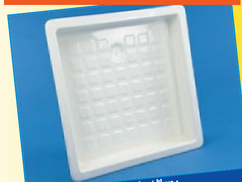
Dimensions du pédiluve : L x l x H = 730 x 640 x 1200 mm