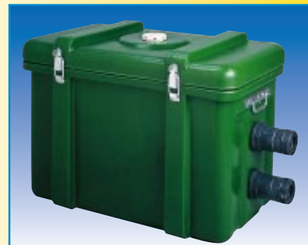
Dimensions du local technique : L x l x H = 680 x 400 x 480 mm