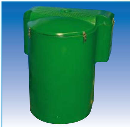
Dimensions du local technique : L x l x H = 1050 x 1050 x 1200 mm